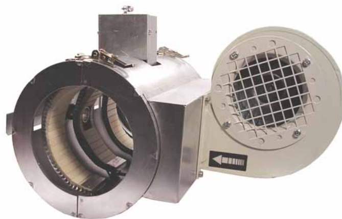
Tryskové těleso keramické s ventilátorem