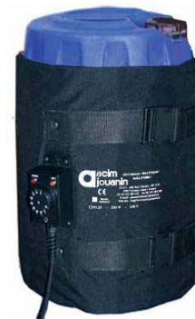
Photo : Ceinture montée sur fût