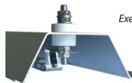
Exemple de montage