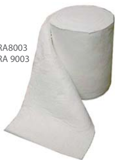
Svítek CERA8003 Svítek CERA 9003