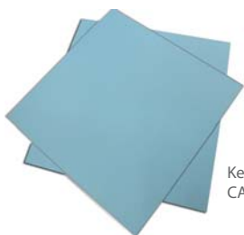
Keramický karton CARTOLANE3