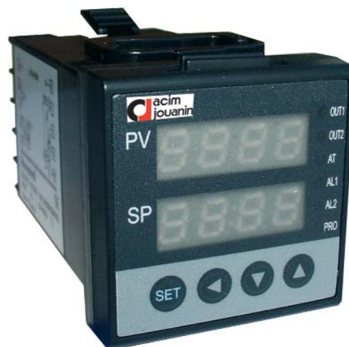
Encombrement du régulateur