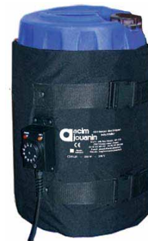
Photo : Ceinture montée sur fût