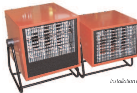
Installation murale uniquement